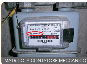
MATRICOLA CONTATORE MECCANICO

La matricola del contatore del gas è un numero che identifica univocamente l'apparato di misura. Questo significa che ogni contatore ha un numero di matricola differente rispetto ad un altro. Questo numero è assegnato in fabbrica dall'azienda produttrice del dispositivo stesso.